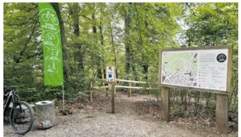
Beim Biketrail im Känzeli handelt es sich um einen kurzen und leichten Weg für Menschen jeden Alters.

sprochen, anstatt gemeinsam mit den Grundstückseigentümern und Sportlern eine Lösung zu finden», so Suter. Das liege unter anderem auch daran, dass es bis anhin keine richtige Vertretung gegeben habe, die sich für die Anliegen der Biker eingesetzt habe. «Mit unserem Verein wollen wir das nun ändern.»